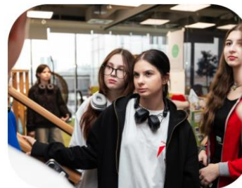
Фото и видео с ярмарки публикуются в сообществах первичных отделений, образовательных организаций, молодёжных и детских общественных объединений в социальной сети «ВКонтакте».